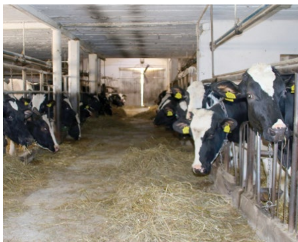
Bydło w gospodarstwie Radziszewskich jest utrzymywane na uwięzi, obecnie stado liczy 50 krów dojnych